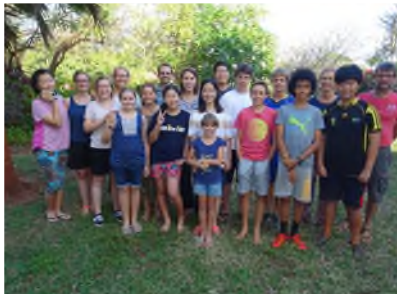
Gruppenbild Internat 2017/18