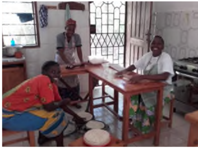
Tortillas auf Holzkohleofen backen in der Nuru Küche