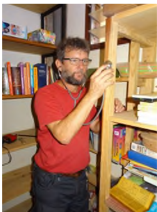
Na, wo steckt der Holzwurm?