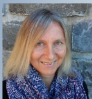
Mit lieben Grüßen

Ich wünsche Ihnen, dass Sie sich von Gott gebrauchen lassen, sei es zur Zeit oder Unzeit!