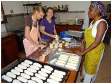
Nuru backen in der Internatsküche (unser Ofen war kaputt)